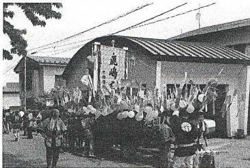
平成22年の十條団地町内会の鹿嶋船です